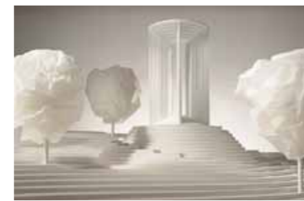
Winterbach Burger Rudacs, München