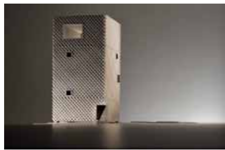
Korb Studio Rauch, München

Abschließend: Anfang Mai entschied die Gesellschaftsversammlung leider, dass sie die temporäre Sperrung der Bundesstraße 29 als Aktion der Remstal Gartenschau nicht will. Sie wäre eine der wichtigsten Aktionen der Landesgartenschau gewesen – ähnlich eindrucksvoll wie die Sperrung der Autobahn A40, des „Ruhrschnellwegs“, in Nordrhein-Westfalen anlässlich einer Kulturveranstaltung. Aber das kriegen die auto-kranken Schwaben nicht hin.