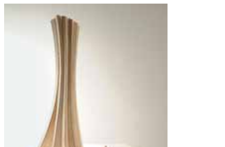
Urbach Menges/Knippers, Stuttgart