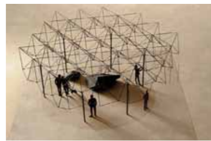
Fellbach Barkow Leibinger, Berlin