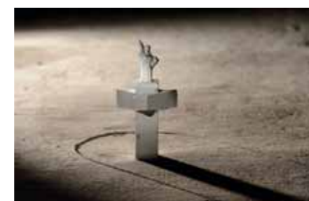
Möggingen Brandlhuber+, Berlin