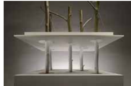
Böbingen Staab Architekten, Berlin