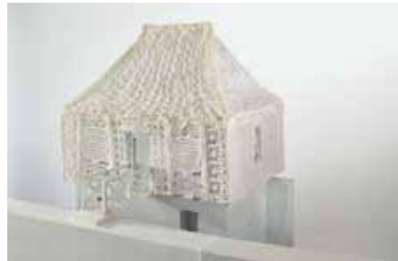
Lorch Hild und K, München