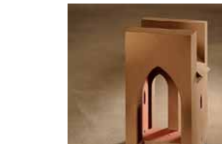
Plüderhausen Uwe Schröder, Bonn