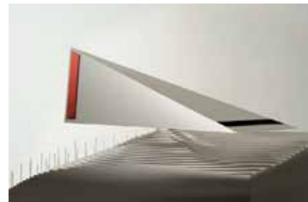
Schorndorf schneider + schumacher, Frankfurt