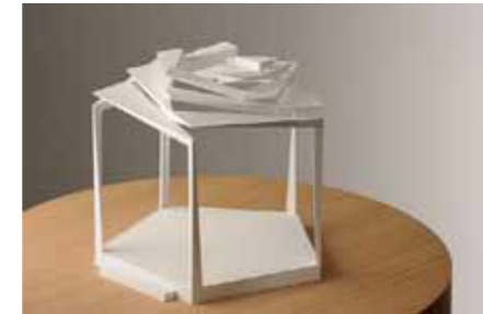
Remshalden Schulz und Schulz, Leipzig