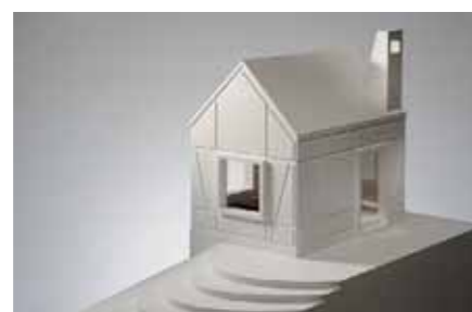
Weinstadt Su und z, München