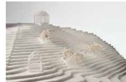
Kernen Kuehn Malvezzi, Berlin