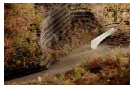
Essingen harris + kurrle, Stuttgart